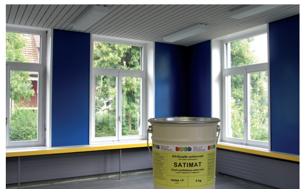
Für dezent seidenmatt Oberflächen ist SATIMAT die perfekte Lösung.

Petrol oder Kerosen geruchlos (auch als Anzündflüssigkeit verwendbar) ist rund 10 mal langsamer verdunstend als Terpentinersatz und daher prädestiniert als Streichverdünner.